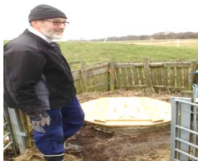
Flot ser det ud og tak for det.

Brønddækslet var blevet så gammelt, så hyrderne var begyndt at frygte, at det ville brase, når spanden skulle trækkes op. Et nyt er blevet fremstillet af sibirisk lærk, som også anvendes til terrasser og er uden imprægnering, som ville kunne forurene brøndvandet. Der er brugt fire længder 32x125x3000 mm. Da dette var målene for det uhøvlede træ, måtte der nye ACAD tegninger til for at få de fire planker, der nu var 115 mm. brede, til at dække – og det gik lige akkurat.